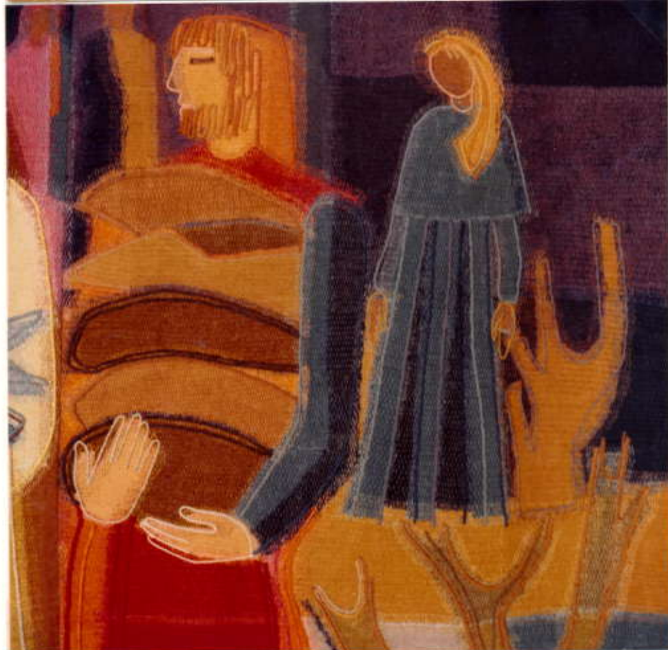
Teipanzel.